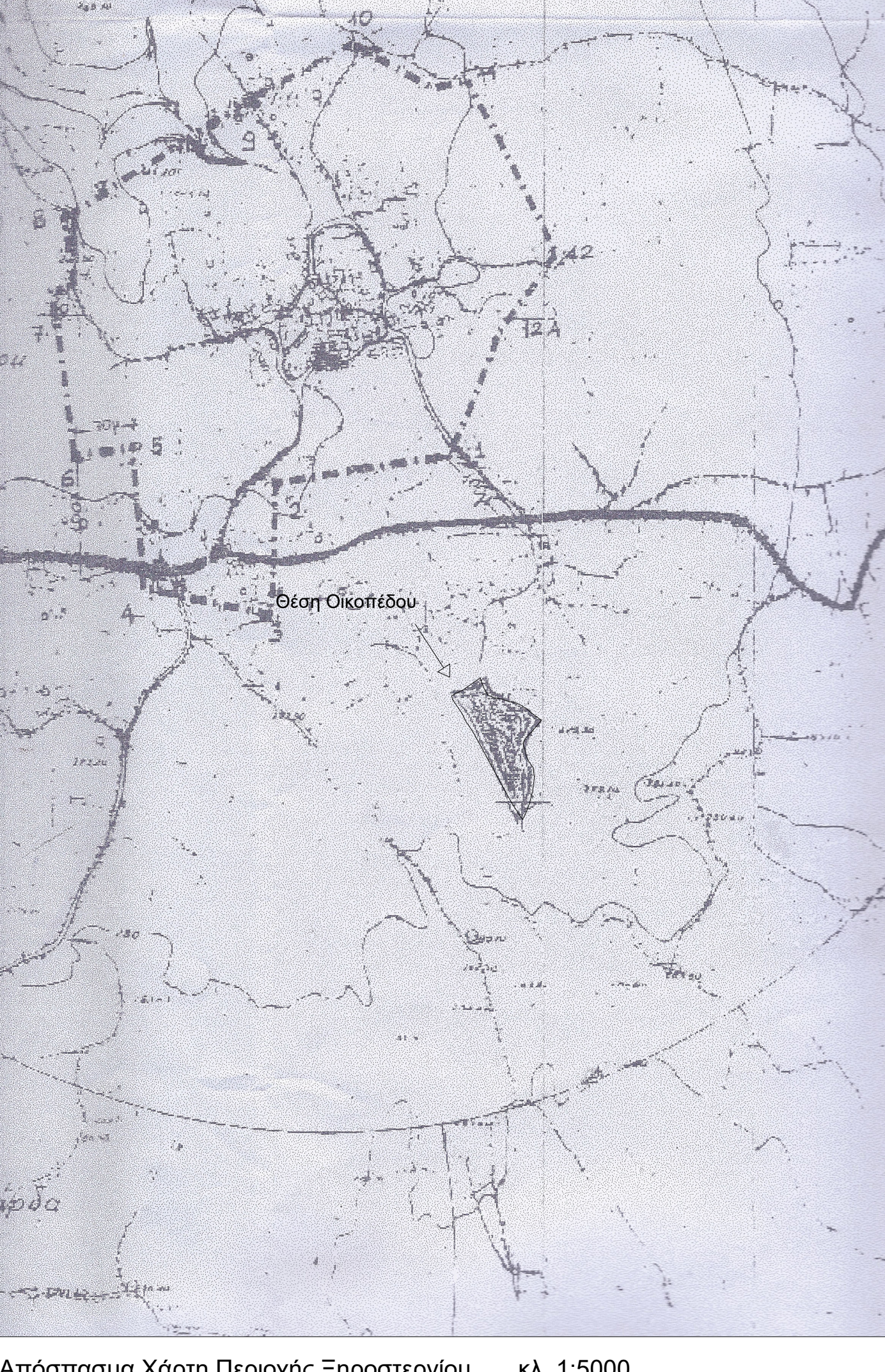
Απόσταση Χάρτη Περιοχής Επρωτέρην κλ. 1:5000